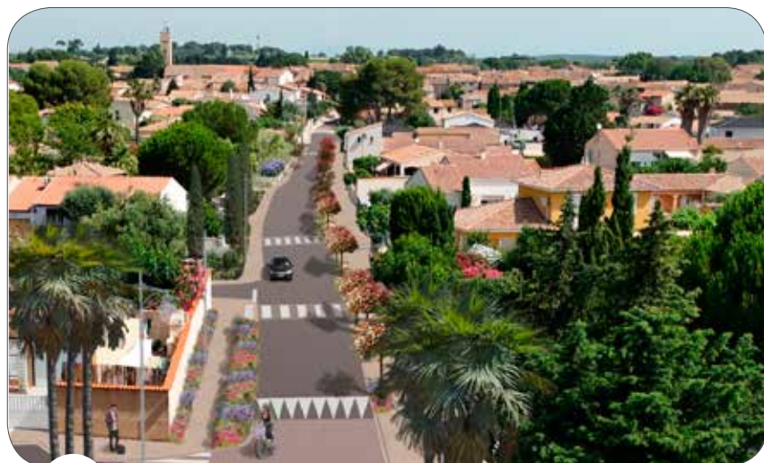
4 L'AVENUE DE LA MÉDITERRANÉE