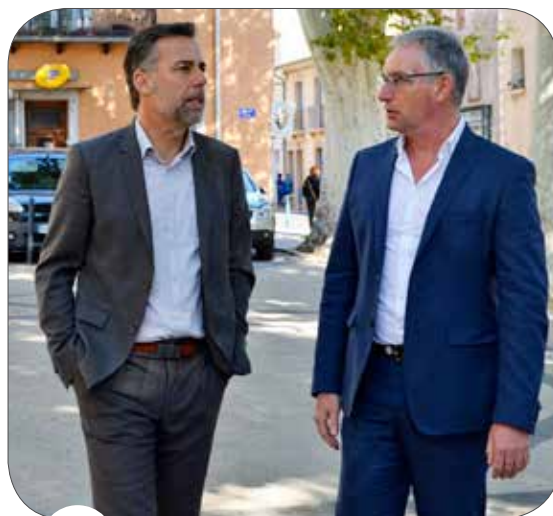
22 LE PRÉSIDENT DE L'AGGLO EN VISITE