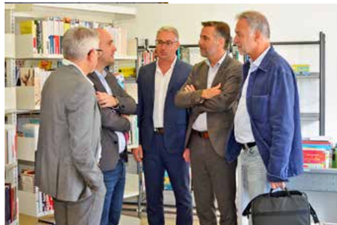
Visite de Sébastien Frey à la médiathèque le 4 octobre

de domicile, d'une pièce d'identité, et d'une auto-risation parentale pour les mineurs de moins de 16 ans. L'adhésion donne ac-cès aux 11 médiathèques ainsi qu'à des services va-riés, notamment la réserva-tion en ligne des ouvrages et un point d'accès Wi-Fi en libre-service pour tous, abonnés comme visiteurs.