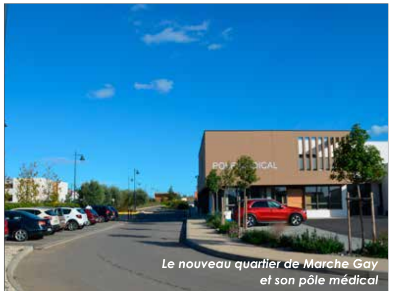
Le nouveau quartier de Marche Gay et son pôle médical

Le village bénéficie également du dynamisme économique de la région, avec des zones d'emploi à proximité et la possibilité, grâce à la fibre, de télé-travailler pour ceux qui souhaitent s'éloigner des centres urbains. Mais ce n'est pas seulement l'accessibilité qui a attiré de nouveaux habitants. Pomérols a su préserver son identité, en mettant en valeur son patrimoine naturel et historique, tout en modernisant ses infrastructures. La viticulture, pilier économique du village depuis des siècles, continue de jouer un rôle essentiel, notamment grâce à la renommée des vins de la région, comme le célèbre Picpoul de Pinet.