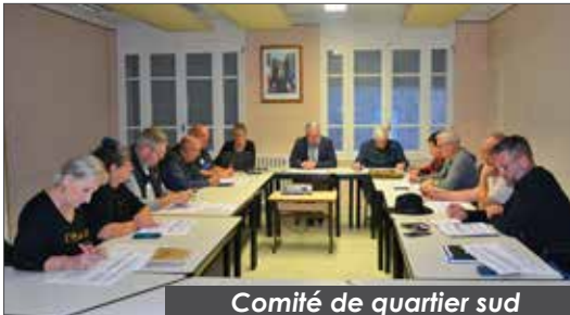
Comité de quartier sud