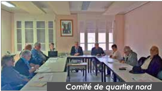
Comité de quartier nord