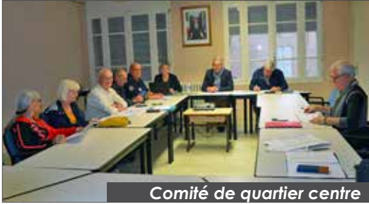
Comité de quartier centre